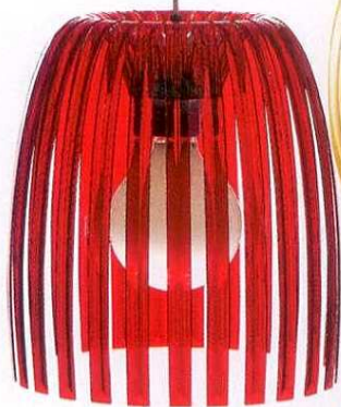
Da Koziol, no El Corte Inglés, €85

Além de darem luz, os candeeiros podem ser autênticas obras de arte.