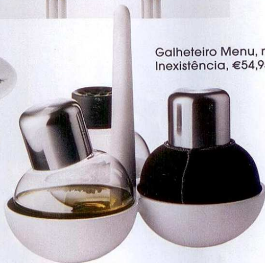
Galheteiro Menu, na Inexistência, €54,95