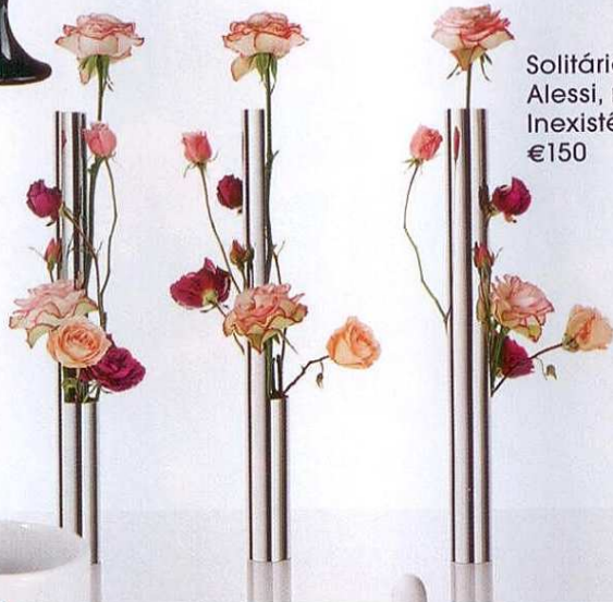
Solitários, Alessi, na Inexistência, €150