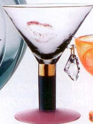
Taças Kostaboda, na Torres & Brinkmann, €168 e €19