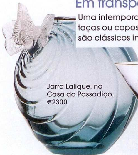
Jarra Lalique, na Casa do Passadiço, €2300

Uma intemporal jarra Lalique, taças ou copos com design são clássicos infalíveis.