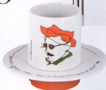
Chávena de café Heterónimos, Vista Alegre, €44 o conj. de 4