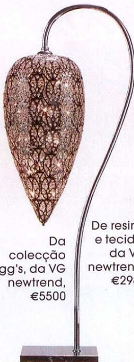
Da colecção Egg's, da VG newtrend, €5500